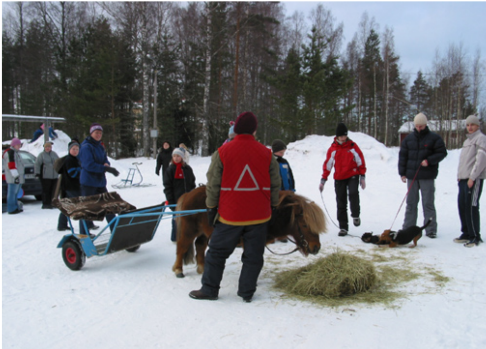
Laskiasriehaa vietettiin MMS-talolla ja Salmisen ahteella sunnuntaina 26.2.06. Paikalla oli runsaasti laskiaisien viettäjiä ja kelikin oli soma. Ponijalukin onnistui hienosti tänä vuonna. Kiitos kaikille osallistujille.