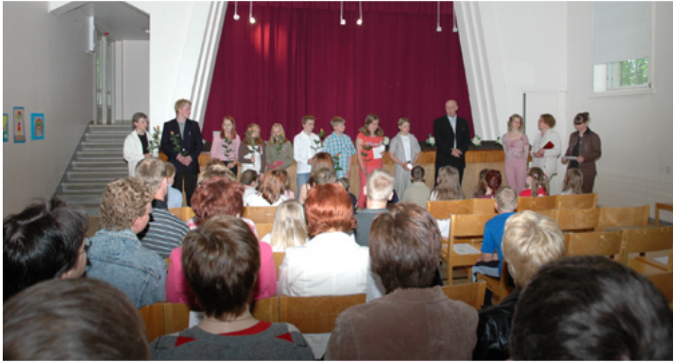
Suvivirttä laulettiin 3.6.06. Vanhempainyhdistys jakoi perinteiset hymypatsaat sekä ruusut koulun jättäville kuudesluokkalaisille.